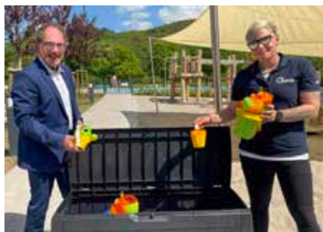
Jede Menge Sandspielzeug für die Kleinen