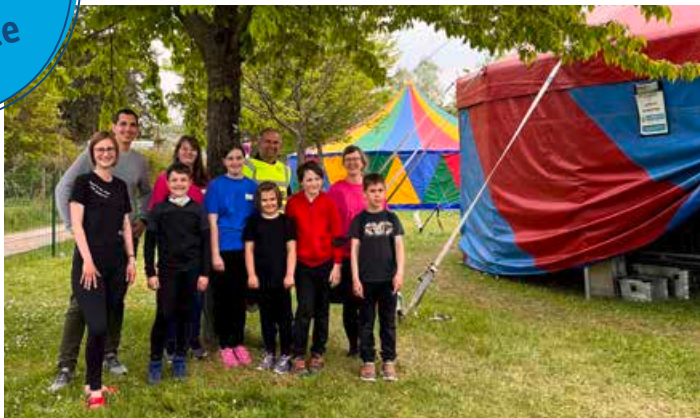
Projektwoche im Circus ZappZarap