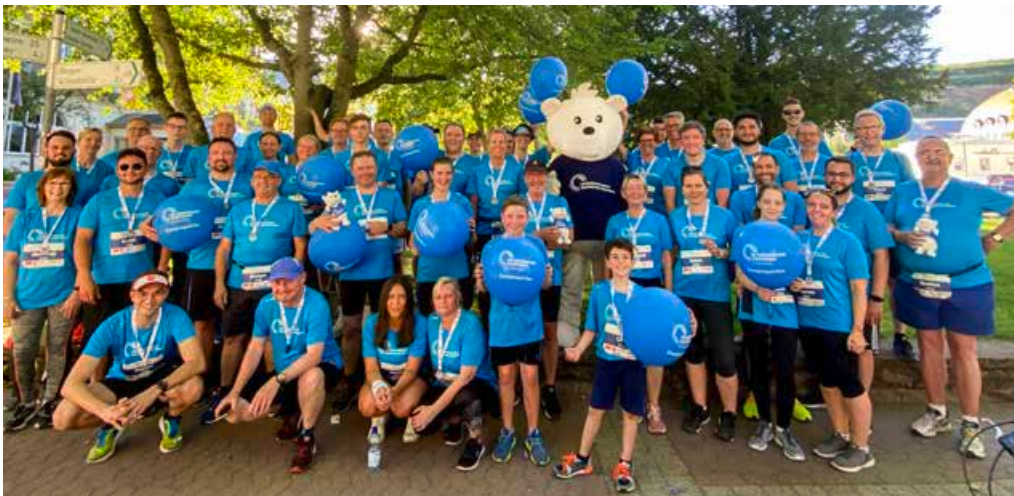
Insgesamt 3.178 Läufer*innen aus 228 Unternehmen starteten im Juni beim Firmenlauf in Bad Kreuznach – davon 60 Teilnehmende der Unternehmensgruppe Kreuznacher Stadtwerke.